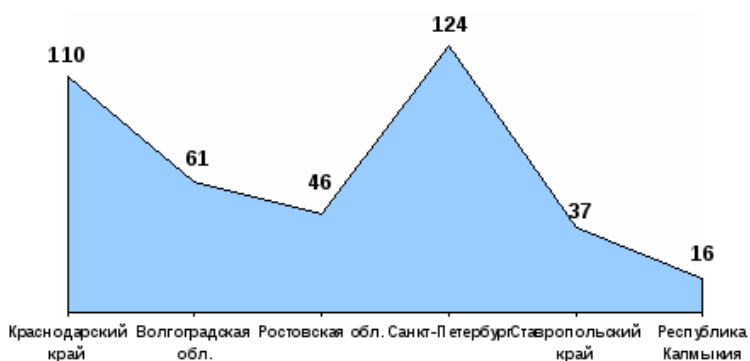
Рисунок 1 – Сведения о количестве учреждений социального обслуживания семьи и детей